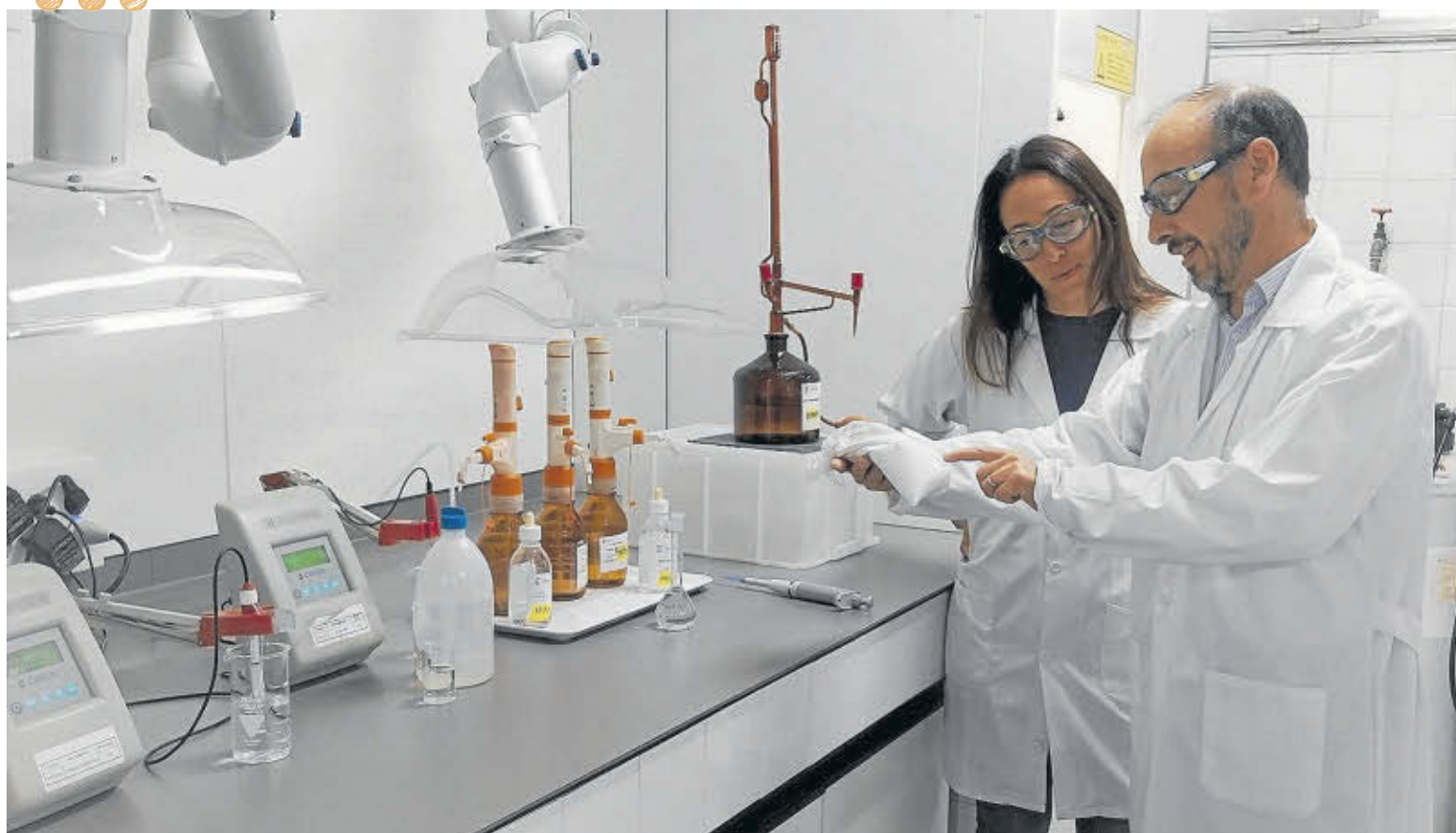
Uno de los laboratorios de Ercros donde se desarrolla el programa de I+D.